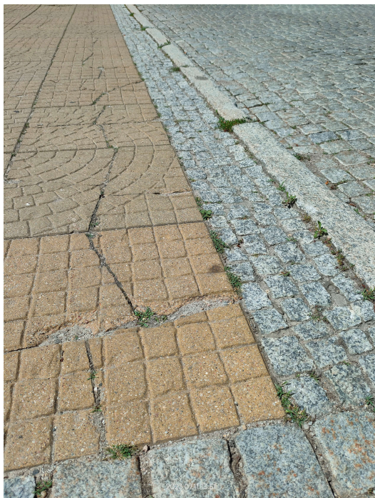
Istniejący zniszczony fragment nawierzchni chodnika ulicy Ratuszowej