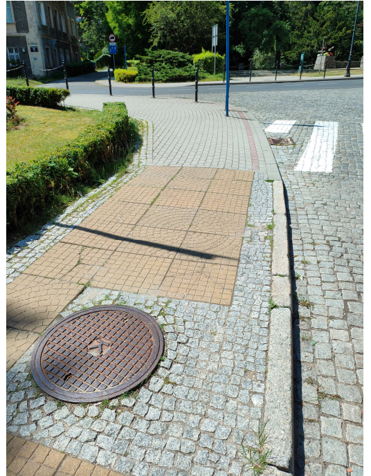
widok na koniec chodnika ulicy Ratuszowej i chodnik ulicy Kolejowej – początek opracowania