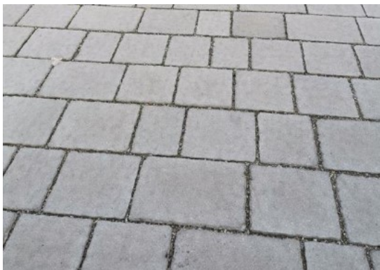
widok na nawierzchnię projektowaną – kostka sudecka „8” classic - szara