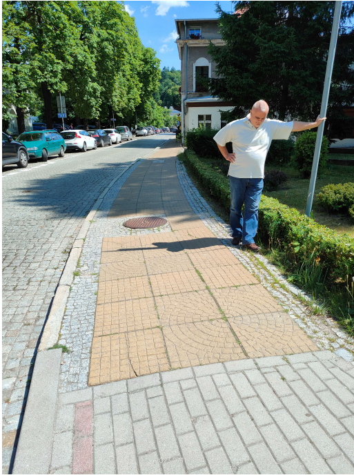
widok na nawierzchnię chodnika ulicy Ratuszowej z początku opracowania od strony ulicy Kolejowej