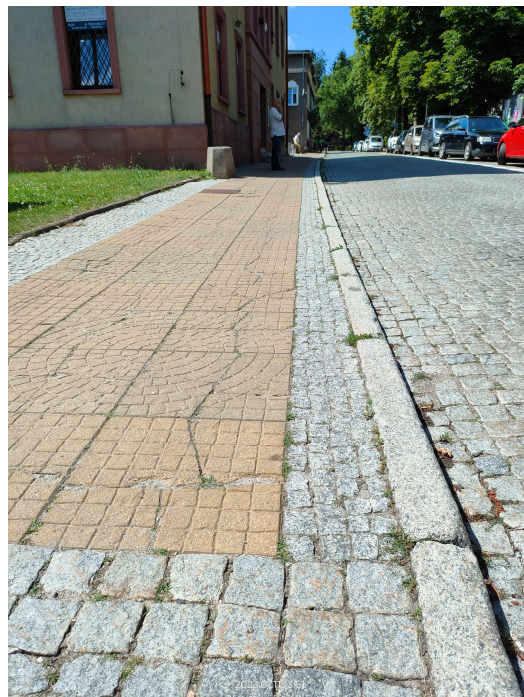
widok na istniejącą nawierzchnie od strony końca opracowania