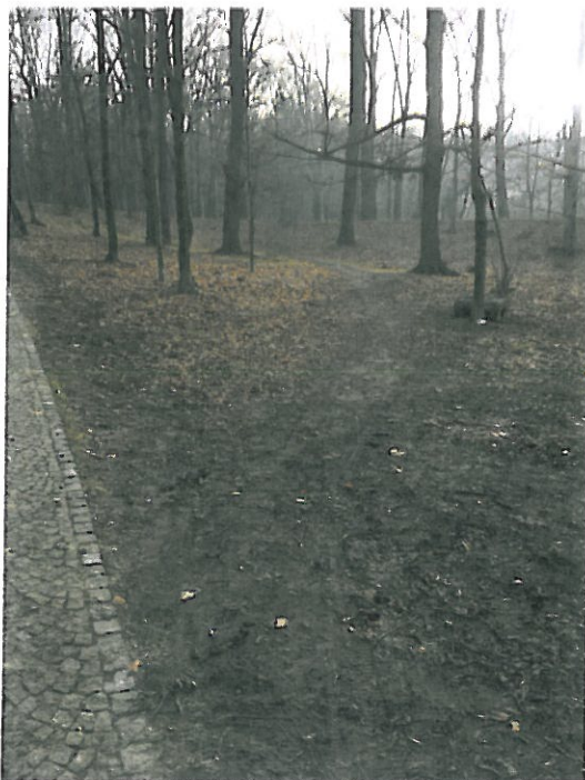
WIDOK NA ISTNIEJĄCY OBSZAR OPRACOWANIA OD STRONY ISTNIEJĄCYCH UTWARDZEŃ ALEJKI PARKOWEJ FOT. NR 1