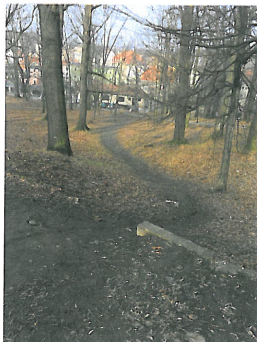
WIDOK NA ISTNIEJĄCY OBSZAR OPRACOWANIA OD STRONY ISTNIEJĄCYCH UTWARDZEŃ ULICY OKRĘŻNEJ FOT. NR 2