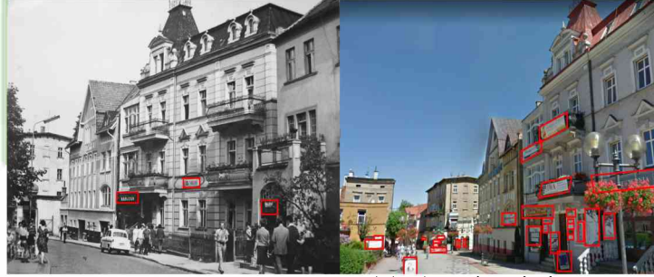
1976 r. [3 szyldy]