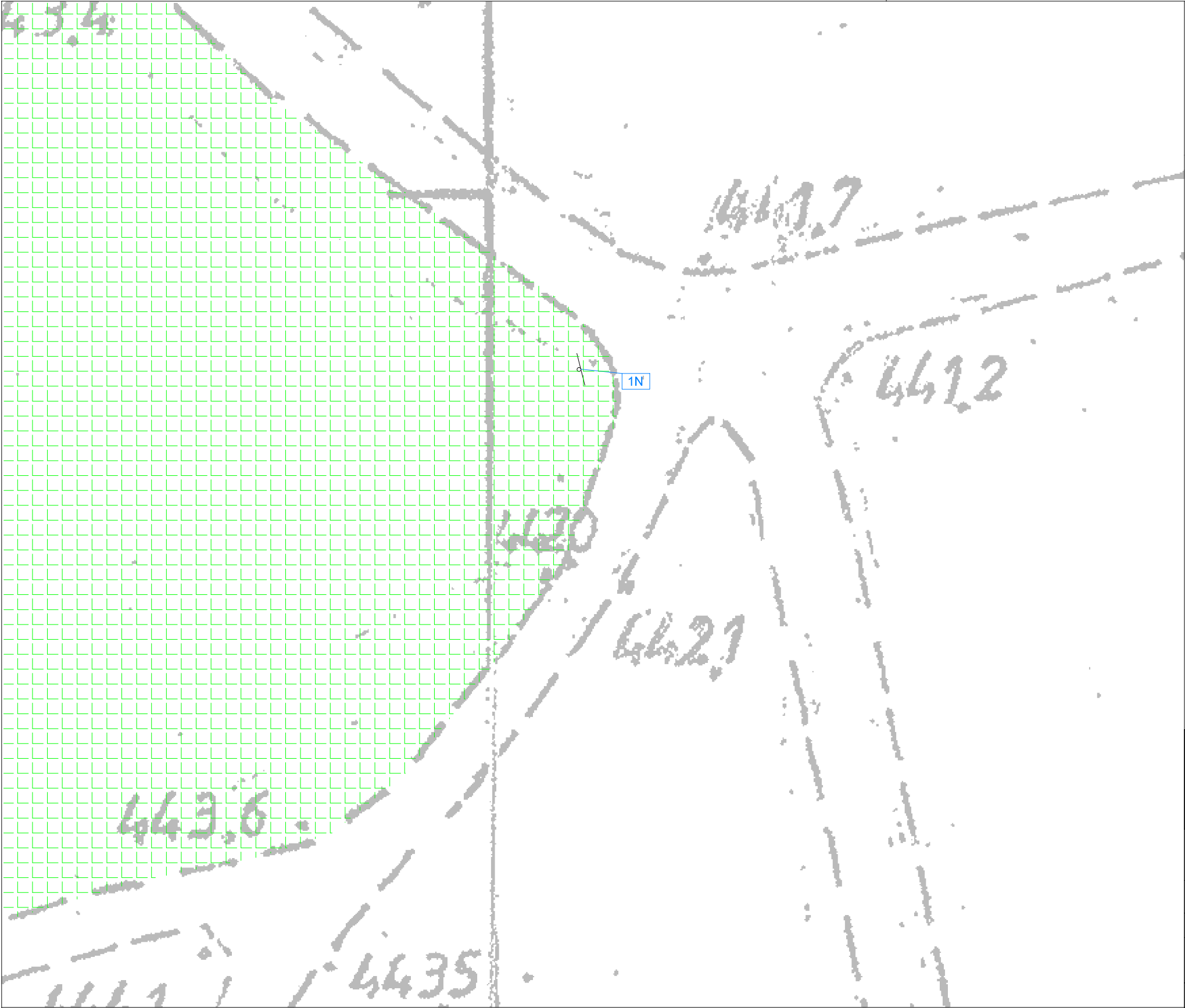
ORIENTACJA PROJEKTOWANEGO PRZYSTANKU W PARKU SZWEDZKIM