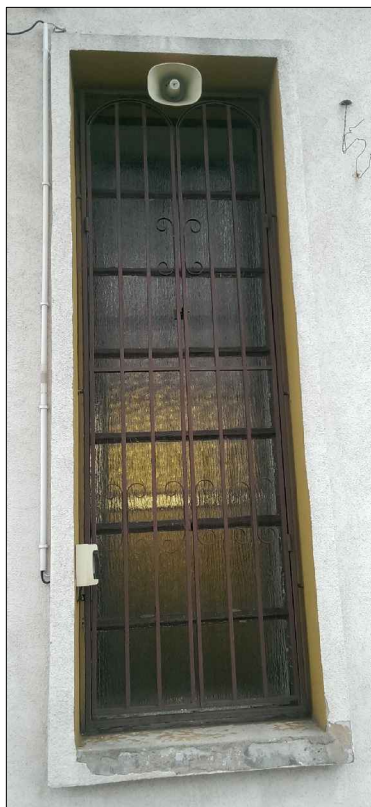
SZCZEGÓŁ-OKNO i KRATA