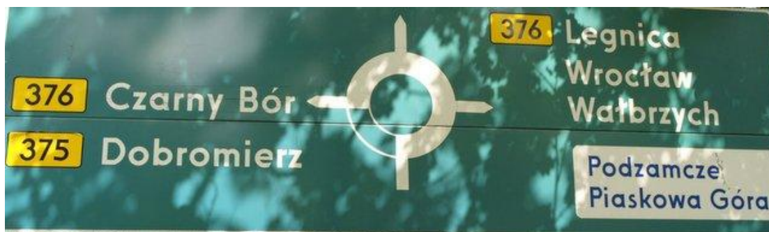
Rys. 1. Tablica E-1 - stan istniejący