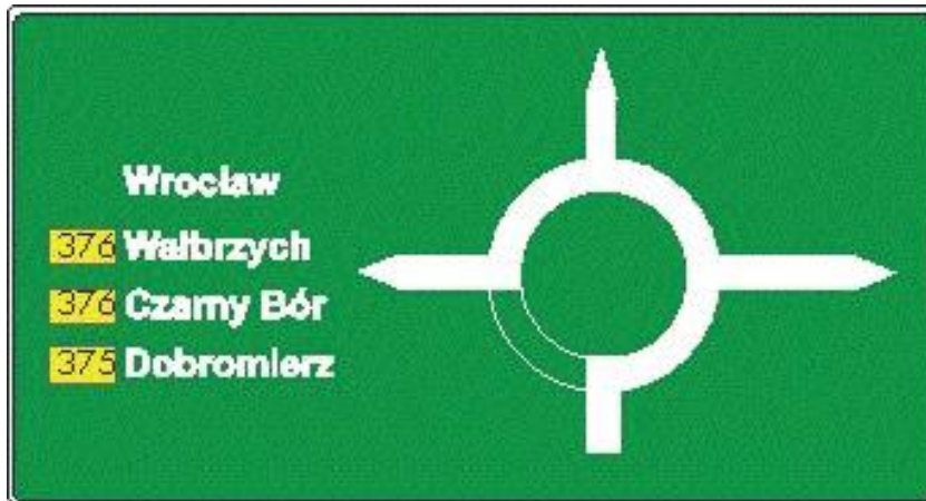
Rys. 2. Tablica E-1 - stan projektowany

Zmianę tablicy drogowskiej należy uzgodnić z zarządem drogi wojewódzkiej.