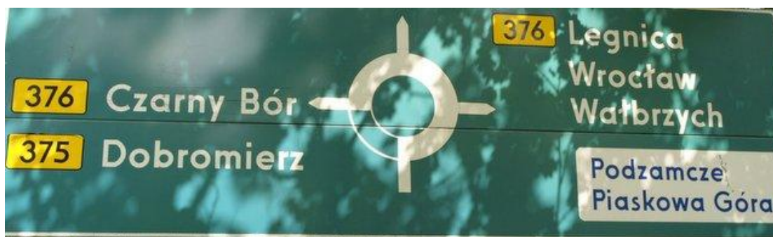
Rys. 1. Tablica E-1 - stan istniejący

W celu wyeliminowania przejazdów tranzytowych ul. Mickiewicza proponuje się wprowadzenie strefy ograniczonej prędkości do 30km/h w obszarze ulic: Od granicy z m. Wałbrzych , tj, od ul. Chopina przez ul. Sienkiewicza, ul. Mickiewicza do DW 375 i ul. Słowackiego do granicy m. Szczawno Zdrój z m. Wałbrzych oraz do skrzyżowania z ul. Kolejową. Utrudnienia dla kierowców , związane z wprowadzeniem strefy „30” powinny spowodować skierowanie ruchu na obwodnicę stanowiącą drogę nr 376 (nowy przebieg). W związku z powyższym należy zmienić tablicę drogowskazową E-1 na ul. Kolejowej przed skrzyżowaniem z ul. Mickiewicza.