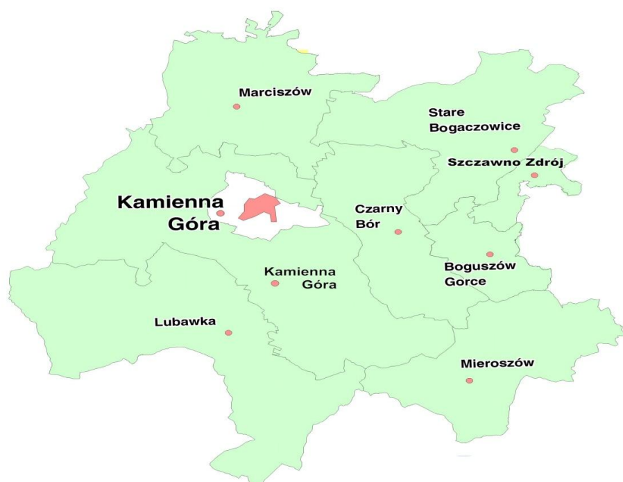
Rysunek 1. Mapa obszaru LSR